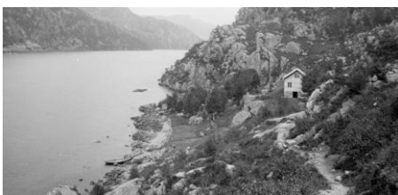
Saie ved Ørsdalsvatnet, innenfor Odlandstøet. ca. 1900.