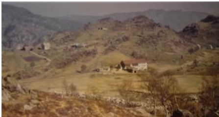
Hytland ca. 1974.

Nye bilder legges ut fortløpende, så følg med!