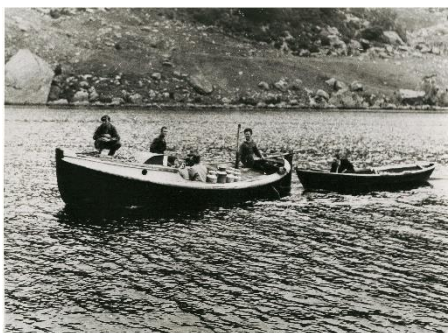
i slutten av 1950-talet.